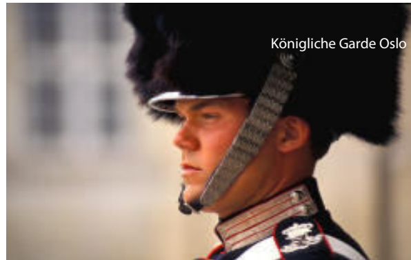
Königliche Garde Oslo

zum Hafen und die Einschiffung auf die Fähre, auf der für uns Außen-Standard-Kabinen vorgesehen wurden. Am Nachmittag verabschiedet sich die Fähre von Kopenhagen und nimmt Kurs auf Oslo. Abendessen und Übernachtung an Bord .