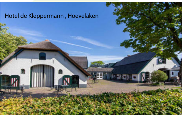
Hotel de Kleppermann, Hoevelaken

Nicht enthalten sind Trinkgelder für Busfahrer, örtliche Reiseleiter und Hotelpersonal sowie evtl. gewünschte weitere Reiseversicherungen.