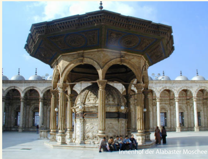
Innenhof der Alabaster Moschee

Wir beginnen unsere Besichtigungen heute mit dem Ägyptischen Museum im bekannten Tahrir Platz . Wer schon einmal in Kairo war, hat dieses Museum sicher schon einmal be-