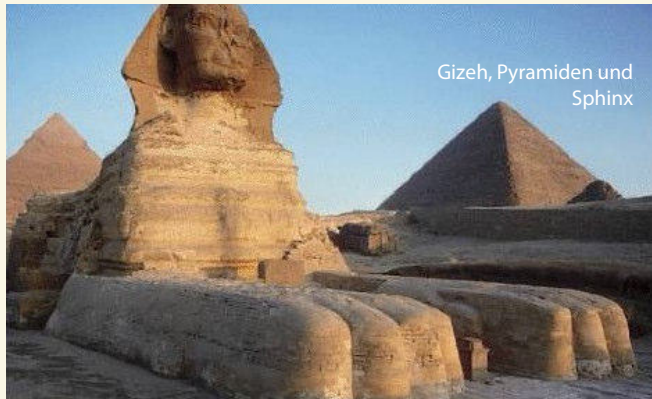
Gizeh, Pyramiden und Sphinx

Diese Reise wurde in 2026 bereits sehr erfolgreich durchgeführt und wird aufgrund der großen Nachfrage in 2027 noch einmal angeboten.