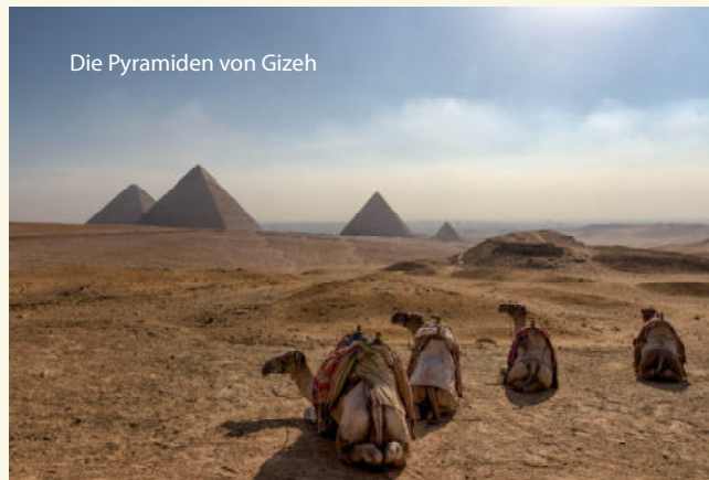
Die Pyramiden von Gizeh

Sollte die Mindestteilnehmerzahl nicht erreicht werden, kann der Veranstalter bis spätestens 30 Tage vor Reisebeginn vom Reisevertrag zurücktreten.