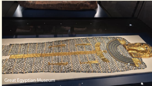
Great Egyptian Museum

Deutsche Staatsbürger benötigen für die Einreise nach Ägypten einen Reisepass , der mindestens noch sechs Monate über das Reiseende hinaus gültig sein muss. Weiter ist ein Visum erforderlich, das bei der Einreise erteilt wird. Die dafür anfallenden Gebühren sind nicht im Tourpreis enthalten und direkt zu zahlen.