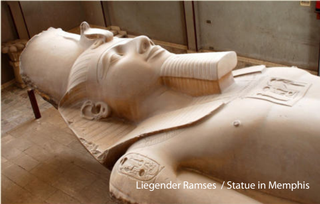
Liegender Ramses / Statue in Memphis

Eine entsprechende Summe führen wir an „atmosfair“ ab.