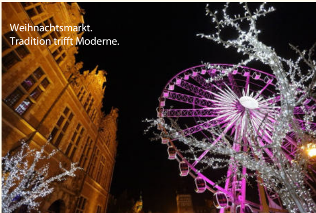
Weihnachtsmarkt. Tradition trifft Moderne.

Nicht enthalten sind Trinkgelder für Busfahrer und örtliche Reiseleitung, Gepäckträgerservice im Hotel und evtl. gewünschte zusätzliche Reiseversicherungen.